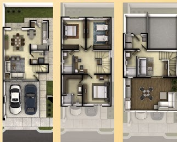
Planta Baja Planta Alta 3er Nivel