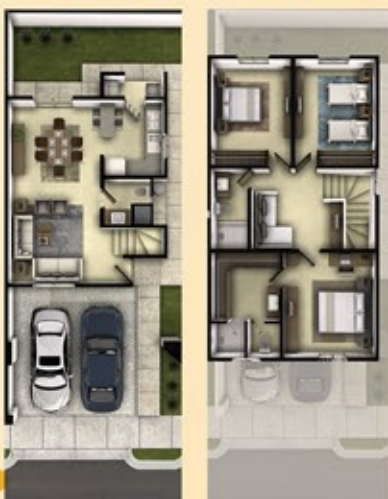
Planta Baja Planta Alta